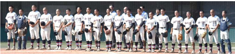
[柏木学園 2回戦 勝利の校歌を唄う、大和スタジアムにて]

大和5校の戦果 ◆柏木学園は1回戦、サレジオに競り勝ちすると2回戦を橘に1-0の完封勝ち、3回戦は多摩に4-3で勝ち上がり、4回戦で第3シードの桐蔭学園に挑戦し大敗を喫したが、昨年と同成績の活躍を示した。◆大和は1回戦、住吉にタイブレークで勝ち上がり、2回戦で第3シードの横浜商業3-9で敗れた。◆大和南は1回戦で川崎総合科学に大敗。◆大和西は2回戦スタートで伊志田に1-8で敗れた◆大和東は2回戦からのスタートで金井に大敗し短い夏が終わった。