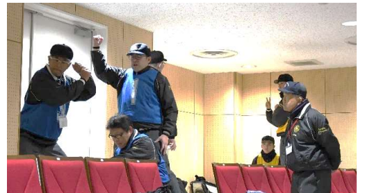
[ 降り続いた雨のため会場を講堂に移して行われた審判講習会 相原高校講堂にて ]